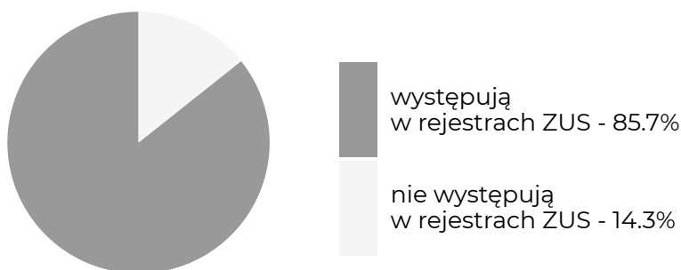
Absolwenci, którzy w okresie objętym badaniem ...